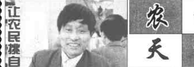
让农民读自己喜欢的书

新华社北京1月19日电 一个把公司、科研单位、基地和农户集为一体的中国二十一世纪的农村模式正在广西环江县试建。 这个叫青肯示范区的新农村,打破了中国几千年来的农村运作的方式,在这里,管理村子的不是农民,而是政府官员、商人、技术人员和环保专家。他们根据市场情况和科技的最新发展,指导农民每年度的种植和饲养。 这个示范区是由广西环江毛南自治县政府、中科院和广西科委投资300余万元,在环江县创办的。示范区有80户共400多人,他们大都是从缺乏基本生存条件的大石山区搬迁出来的贫困少数民族同胞。 在不少农户家门前,都挂着小黑板,公司技术人员在上面写着施肥比例的提示和引进新品种的预告。 根据规划,到本世纪末,示范区将建成以果、蔗、畜为主的支柱产业,每个农民将获得超过全国平均水平的年收入。 (李丽芳)