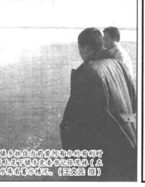
小尾寒羊寄深情 市财政局驻利津县某村工作组组织帮扶当地农村经济的发展。他们为该村多养小尾寒羊，每户补助资金3000元，用于购买小尾寒羊。该村农民高兴地说：“包乡组帮扶真是好。”(高福强)